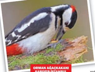
ORMAN AĞAÇKAKANI SARIYER-İSTANBUL

kuşların çoğu ilkbaharda renk değiştirir diğün kostimlerini kuşanıyor. Bu alemde beğenen diğirdir, bu yüzden erkekler kılıktan kılığa girer, şirinlik yapıyorlar.