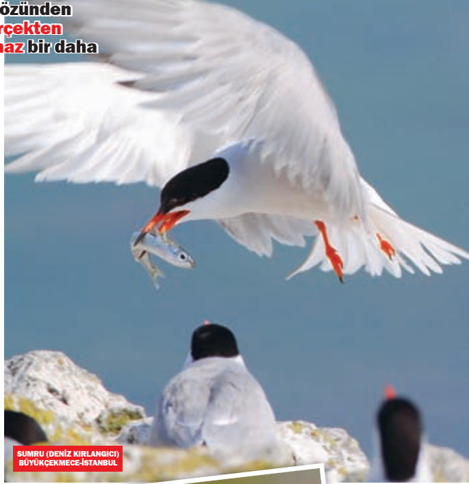
SUMRU (DENİZ KIRLANGICI) BÜYÜKÇEKMECE-İSTANBUL

kuşların çoğu ilkbaharda renk değiştirir diğün kostimlerini kuşanıyor. Bu alemde beğenen diğirdir, bu yüzden erkekler kılıktan kılığa girer, şirinlik yapıyorlar.